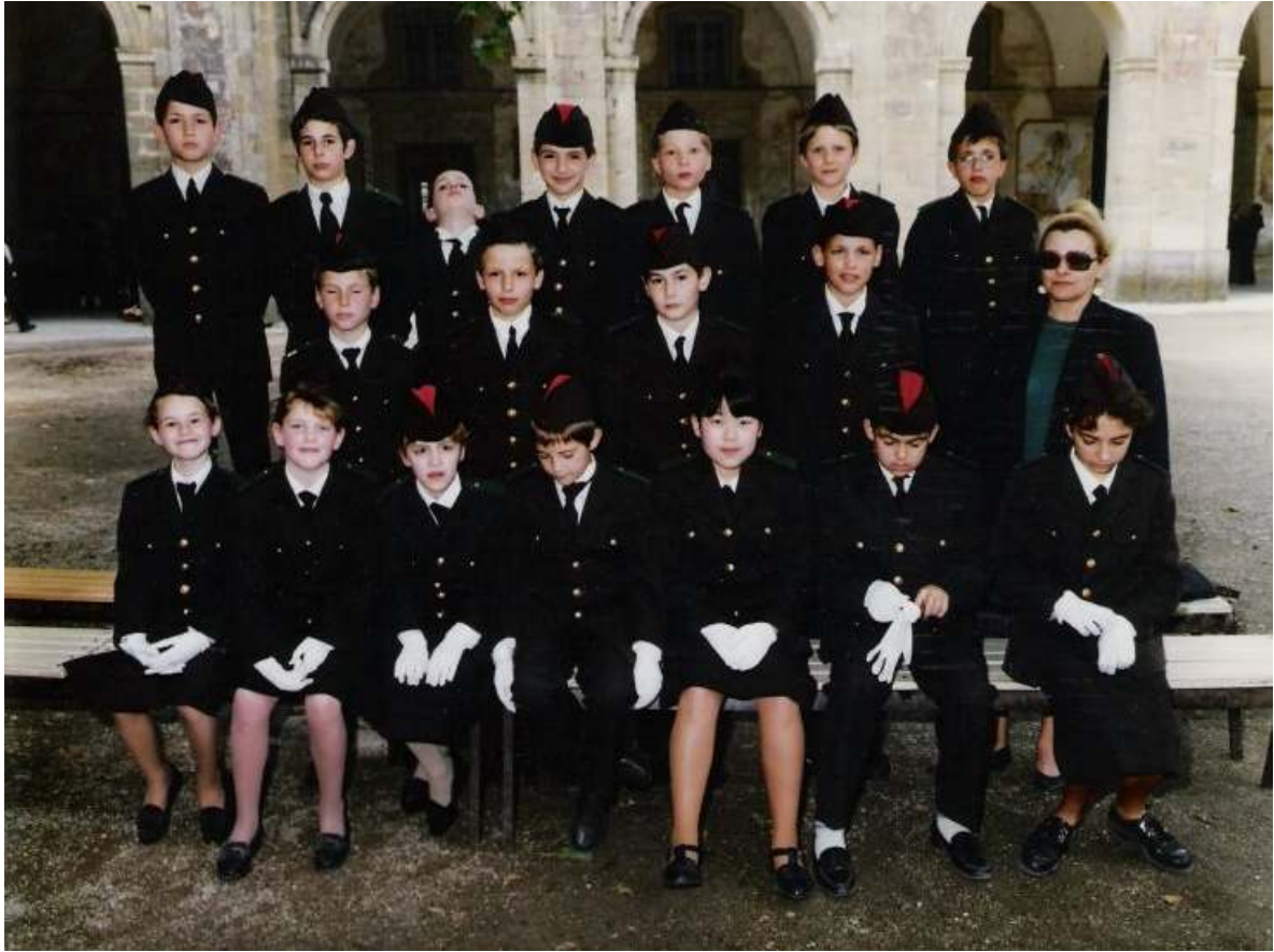
La classe de septième en 1989-1990