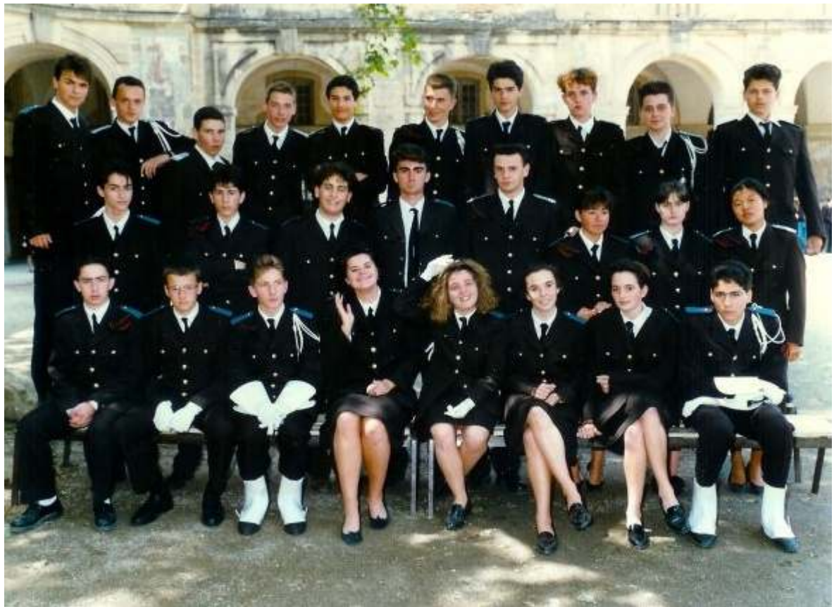
Une classe des Bleus en 1990-1991