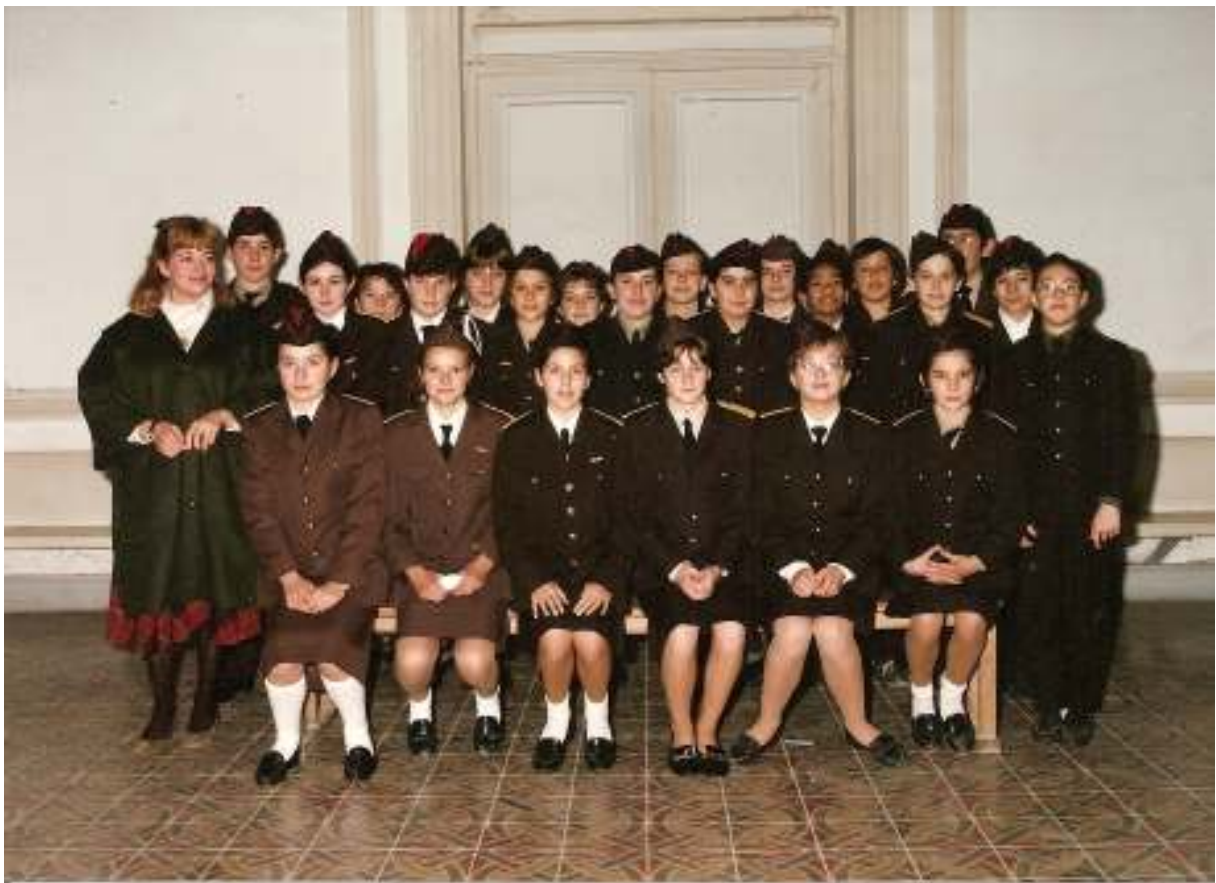
Classe de cinquième 1985-1986