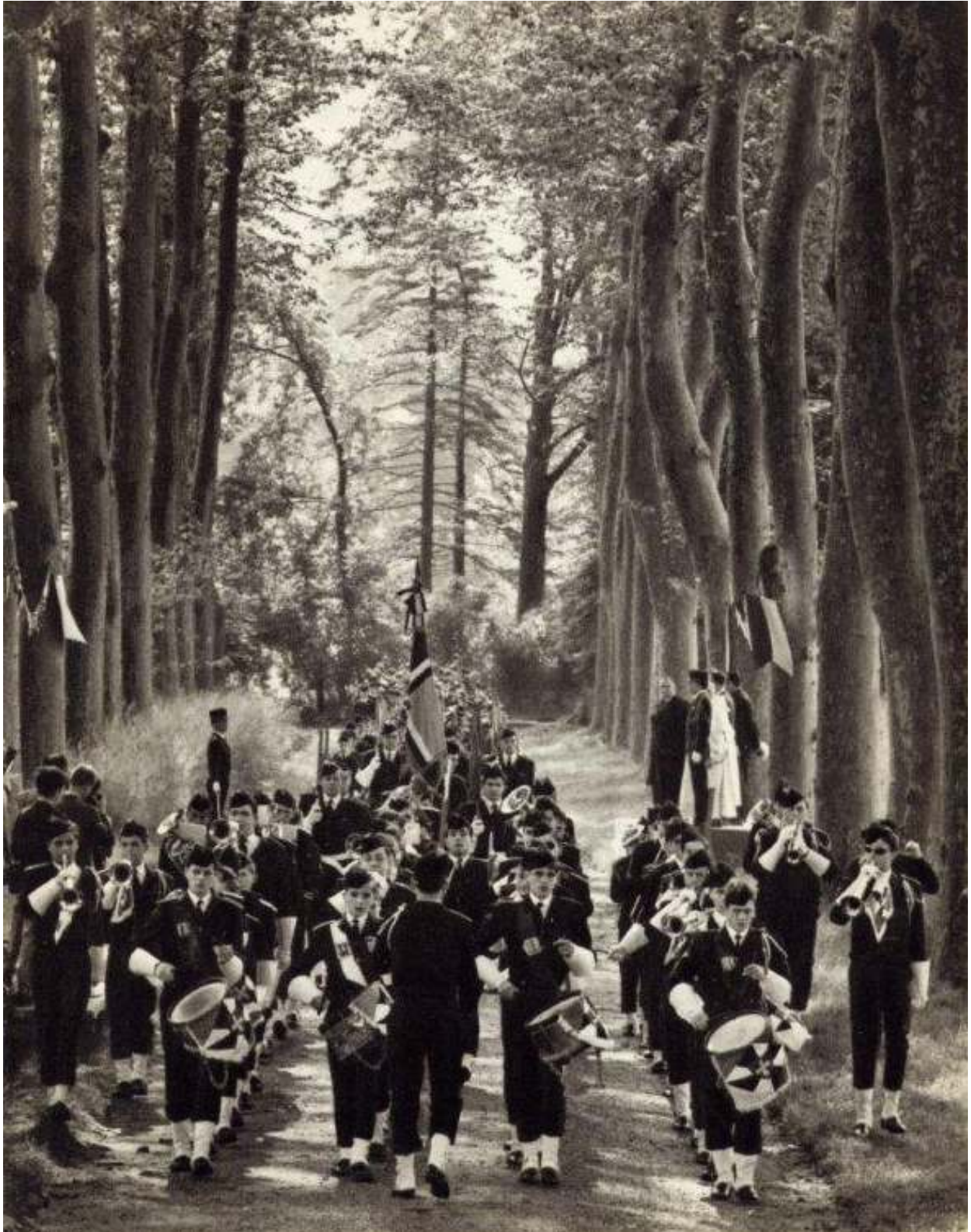
La fanfare en 1965