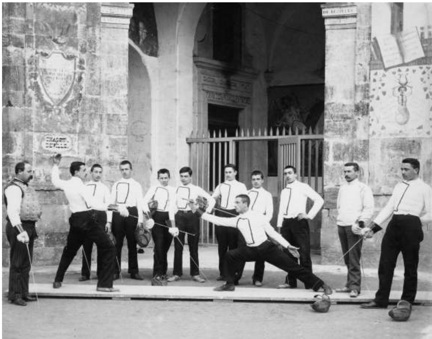
Escrime au début du siècle