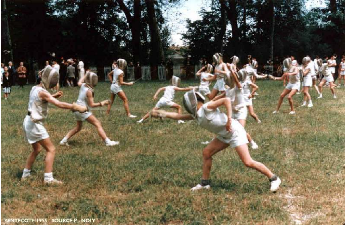
Escrime à la Pentecôte 1955