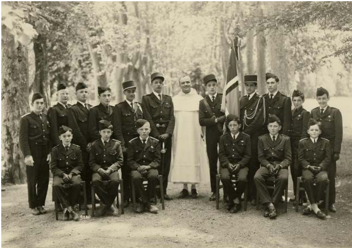
Ecole de Sorèze 1957-1958