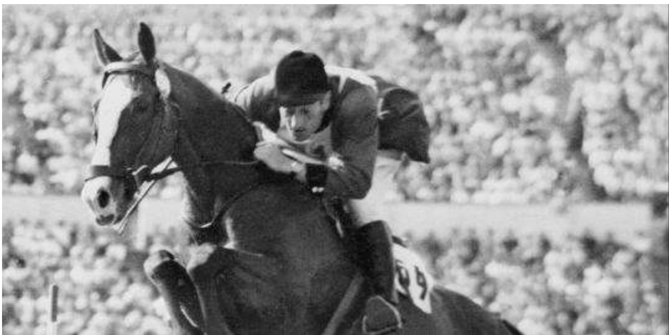
Aux Jeux Olympiques de Tokyo en 1964 sur Lutteur B