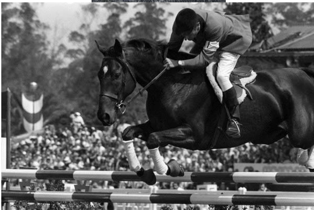
Aux Jeux Olympiques de Mexico en 1968