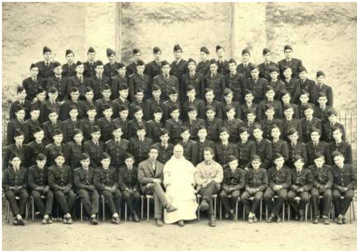
Ecole de Sorèze Division des Collets Bleus 1960/61

YOLGIE & PETITIN 11, rue P.A. Carron 11000 SORÈZE