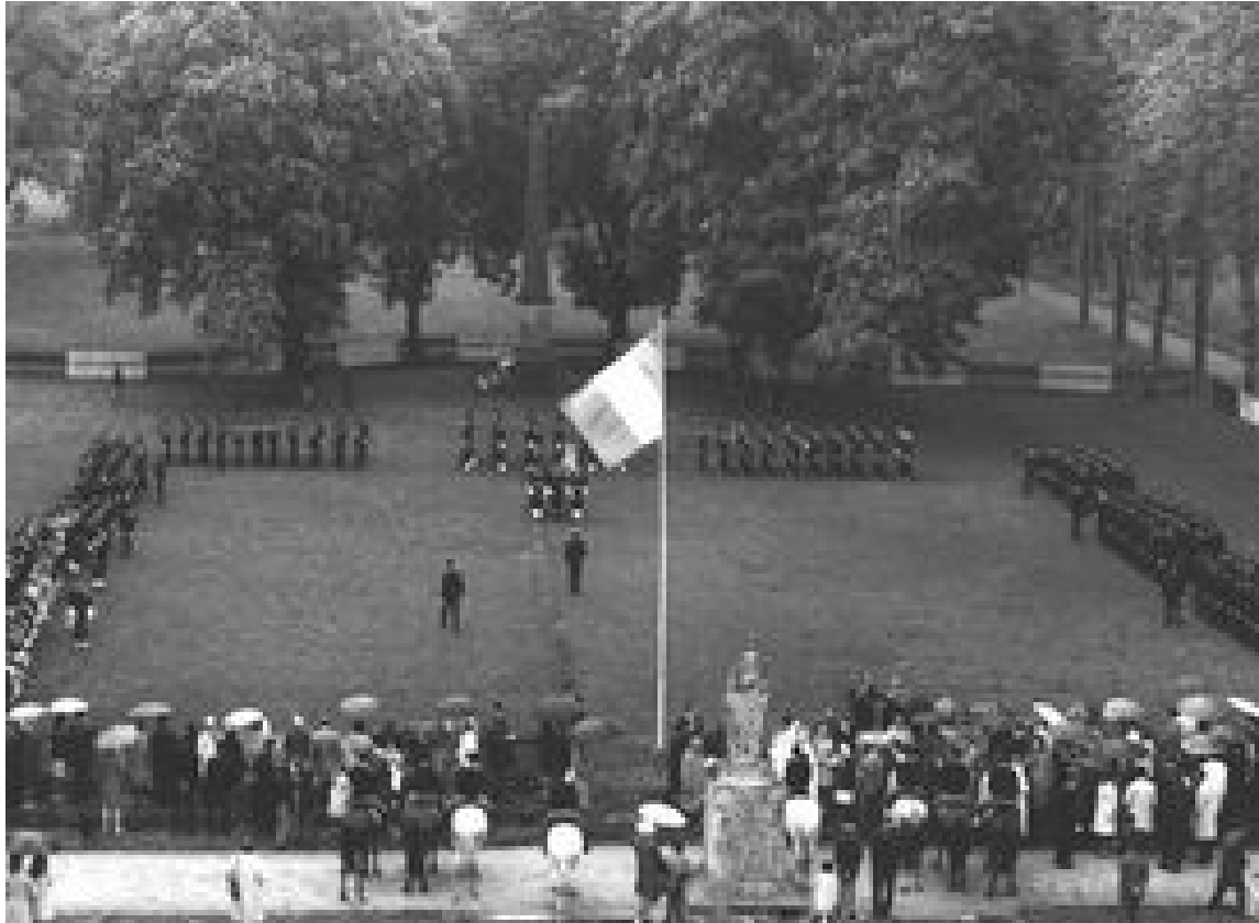
11 novembre 1978