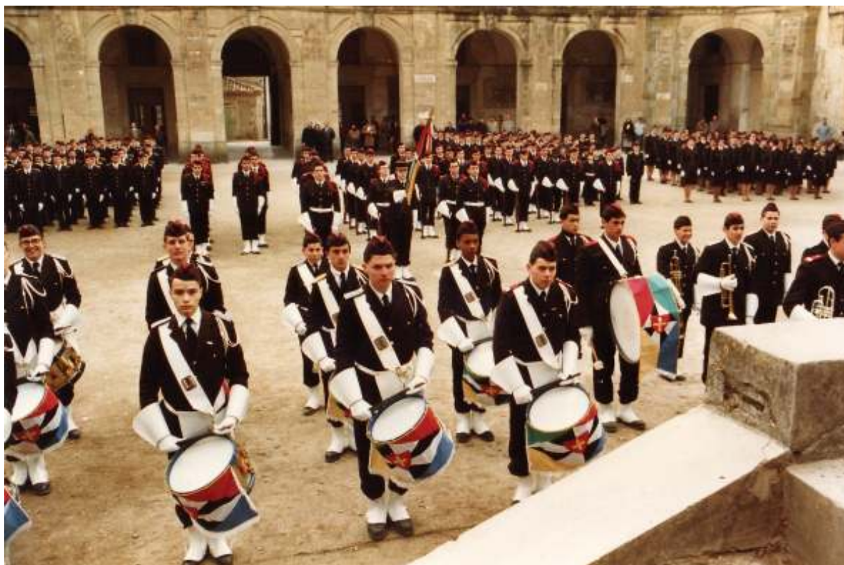
La fanfare en 1987-1988