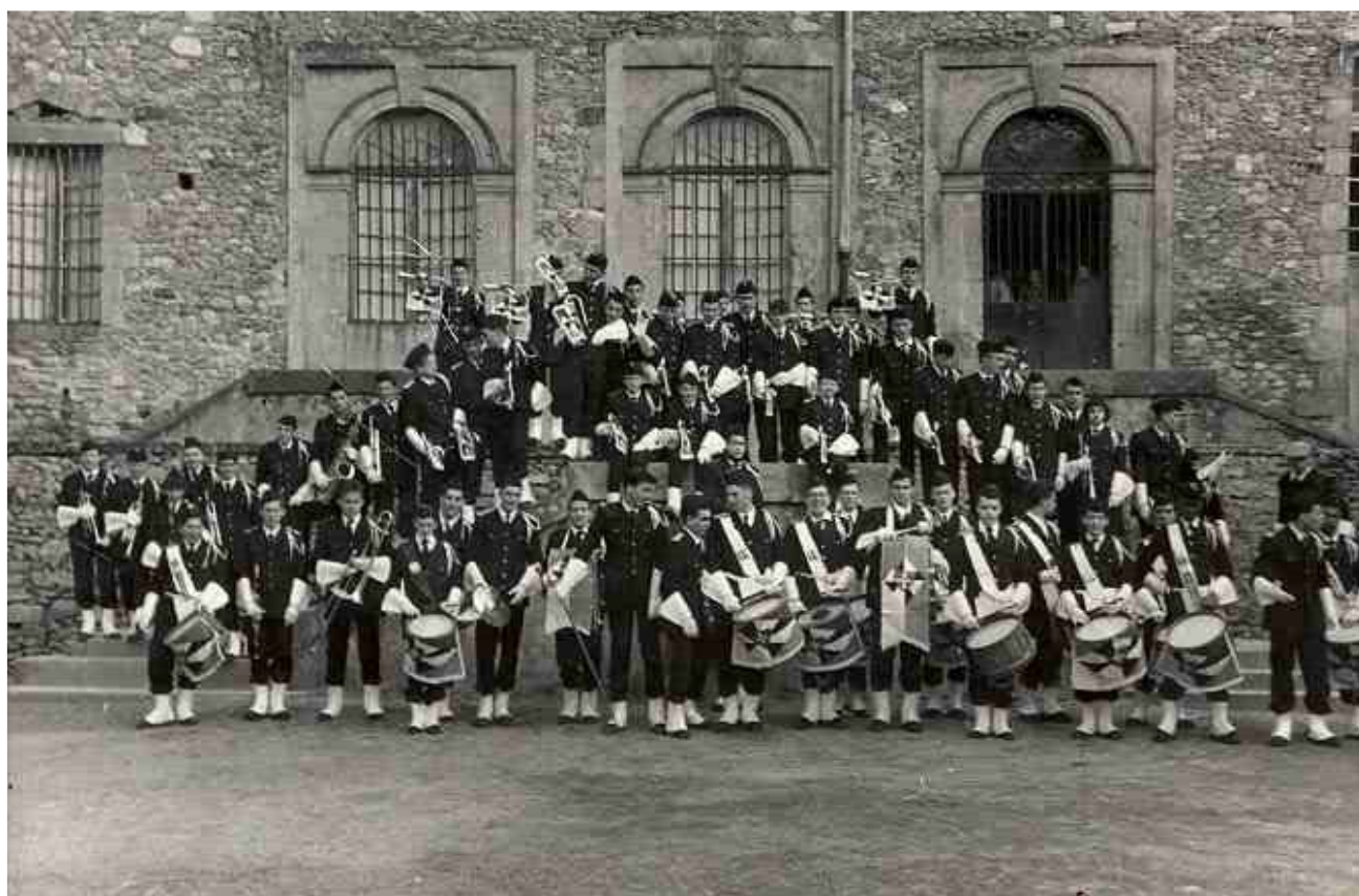
La fanfare en 1988