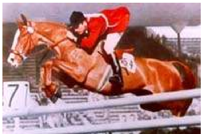
Sur Ali Baba aux J.O d'Helsinki