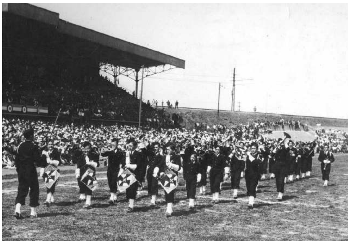
La fanfare à Carcassonne pour la finale du championnat de rugby à 13 en 1949