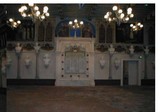
La Salle des Illustres