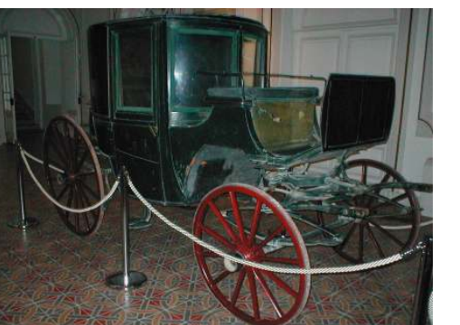
La Salle Centrale et le « bolide » du Père Lacordaire