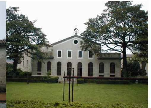
Les bâtiments cour des bleus